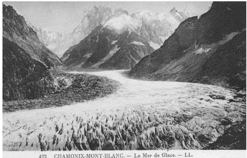
492 CHAMONIX-MONT-BLANC. — La Mer de Glace.

La convention concrétise le principe de responsabilité collective de la protection du patrimoine de l'humanité. La demande d'inscription d'un site au patrimoine mondial doit provenir du pays où il se trouve et doit inclure un plan d'aménagement exposant en détail la protection et la gestion dont il fera l'objet. Les pays alpins sont invités à faire des nominations conjointes pour les sites transfrontaliers.