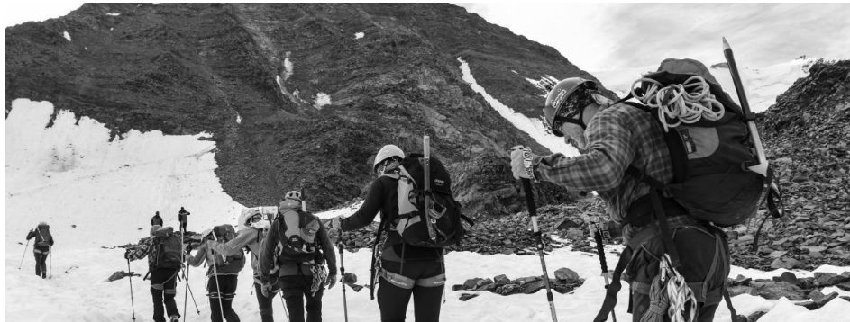
Des alpinistes prennent "le couloir du goûter" pour monter le Mont-Blanc, le 6 août 2018.

Le maire de Saint-Gervais annonce l'instauration d'un quota quotidien censé limiter les incidents sur le Mont-Blanc. Édité par Thomas Pontillon, Franceinfo Radio France, 04/09/2018