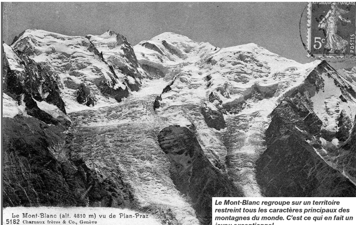
Le Mont-Blanc (alt. 4810 m) vu de Plan-Praz 5182

Le Mont-Blanc regroupe sur un territoire restreint tous les caractères principaux des montagnes du monde. C'est ce qui en fait un joyau exceptionnel.