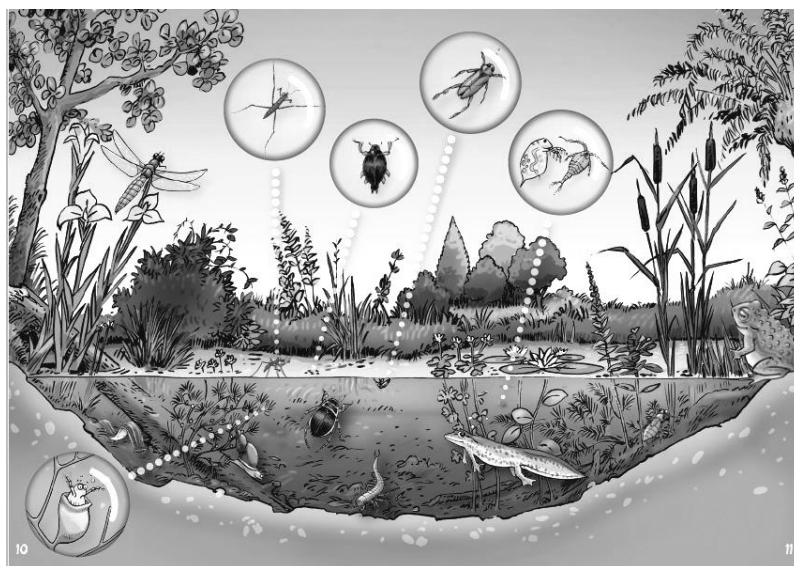
Exemple de la biodiversité dans une mare